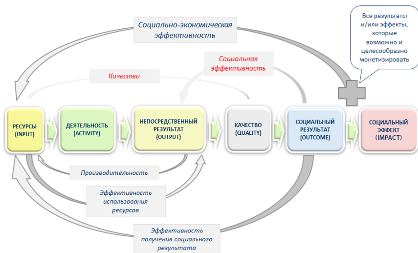
Рисунок 2. Цепочка социальных результатов и виды эффективности.

Социальные результаты (outcomes) и социальные эффекты программ (impacts), которые могут быть измерены и выражены в стоимостных единицах, могут воплощаться в виде следующих социальных изменений: